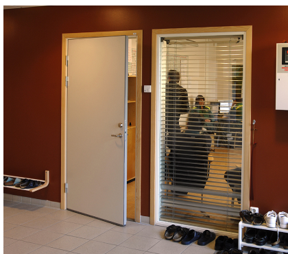
Lyddøre 40dB benyttes oftest i samlingslokaler