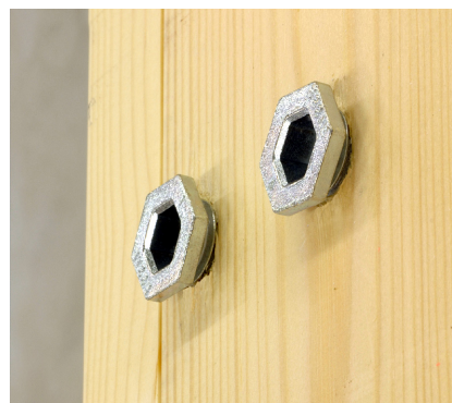
Hurtig montering og fastgøring vha. fabriksmonteret justeringsskruer